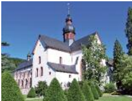
Basilika des Klosters Eberbach

Ein Konglomerat avangardistischer Mäander, erotischer Akzentuierungen und traditioneller wie archaischer Strukturen. Einfach schöne künstlerische Arbeiten für die ganz besonderen Momente des Lebens. Luxus für den Alltag.